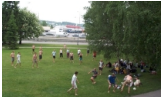
Mass-fotboll i väntan på båten i Åboparken. Först besegrades OK Tisaren med hjälp av vår mycket effektiva 9-8-5-uppställning. Hagaby/Milans 13-5-11-formering visade sig dock överlägsen...

samt ett nytt pikant inslag, det erbjöds brottning. Tisaren-KFUM-Milan började spela fotbollsturnering (senare anslöt även blåtomtarna i Hagaby) med blandat resultat, KFUM gjorde i alla fall inte bort sig även om vi är lite besvikna på fotbollsspelande brodern Olsson, han dominerade inte alls så som vi tänkt oss.