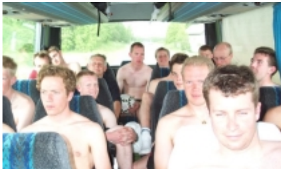
Varmt i bussen...

Som vanligt när man kommer till färjeterminalen var det varmt, trångt och orienterare överallt. Mycket roligt brukar vara att iaktta de som inte är orienterare på Jukolafärjan, de brukar sticka ut. Nåväl, efter att vi alla tryckt smörgåsbord så att man nästan mår dåligt, sovit i de vanliga trånga hytterna och ätit en stabil färjefrukost var vi framme i Finland och tog bussen bort mot TC som låg strax innanför Vasa. I år var det bara 30 mil att åka buss i Finland, betydligt längre resor än så har det varit och det blir lite lite tröttsamt ibland.