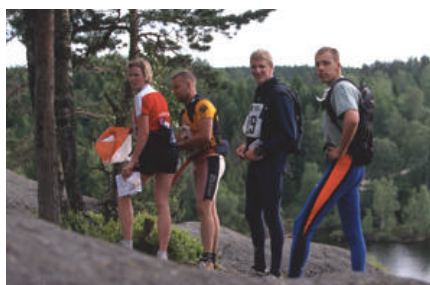
Bilder från fjolårets Multisport vid Dammenlägret