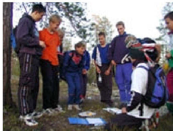
Klurigheter för att få ledtrådar till att lösa Stadjans hemlighet.